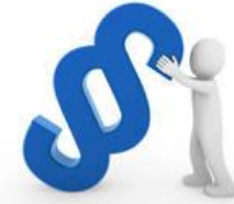
Wirtschaft und Recht